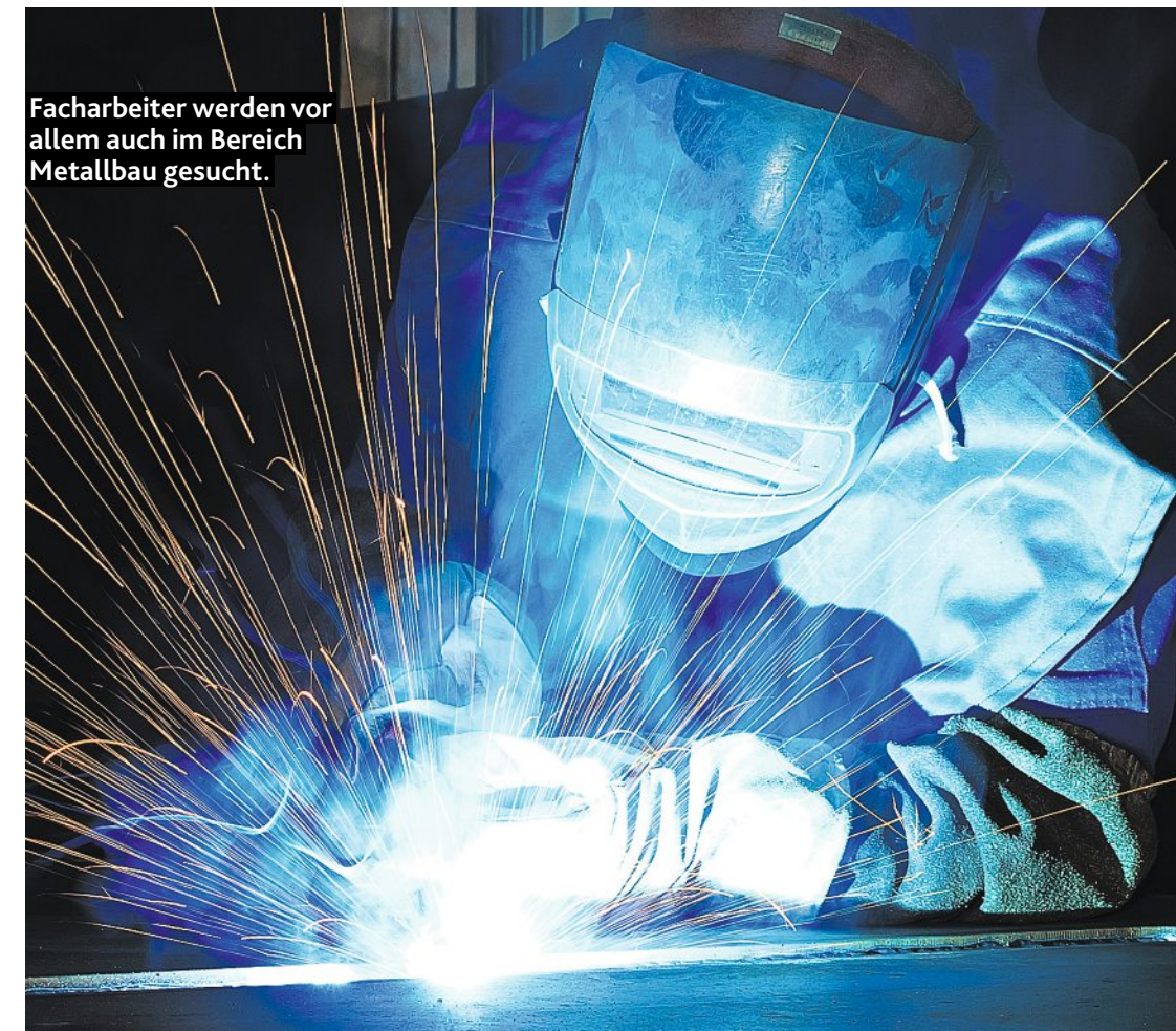
Facharbeiter werden vor allem auch im Bereich Metallbau gesucht.