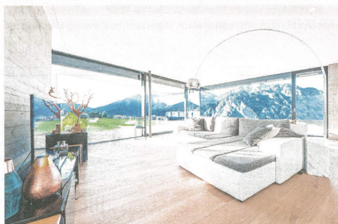
Internorm bietet höchste Produktqualität zu 100 Prozent „Made in Austria“

Auch bei Neubauten sind die Fenster wesentlich für die Energiebilanz des Hauses: Mit modernen Fenstersystemen mit Drei-Scheiben-Isolierverglasung lassen sich bei einem durchschnittlich großen Einfamilienhaus rund 900 Liter Heizöl jährlich einsparen. Dabei lassen sich die Fenstersysteme von Internorm ideal mit großflä-